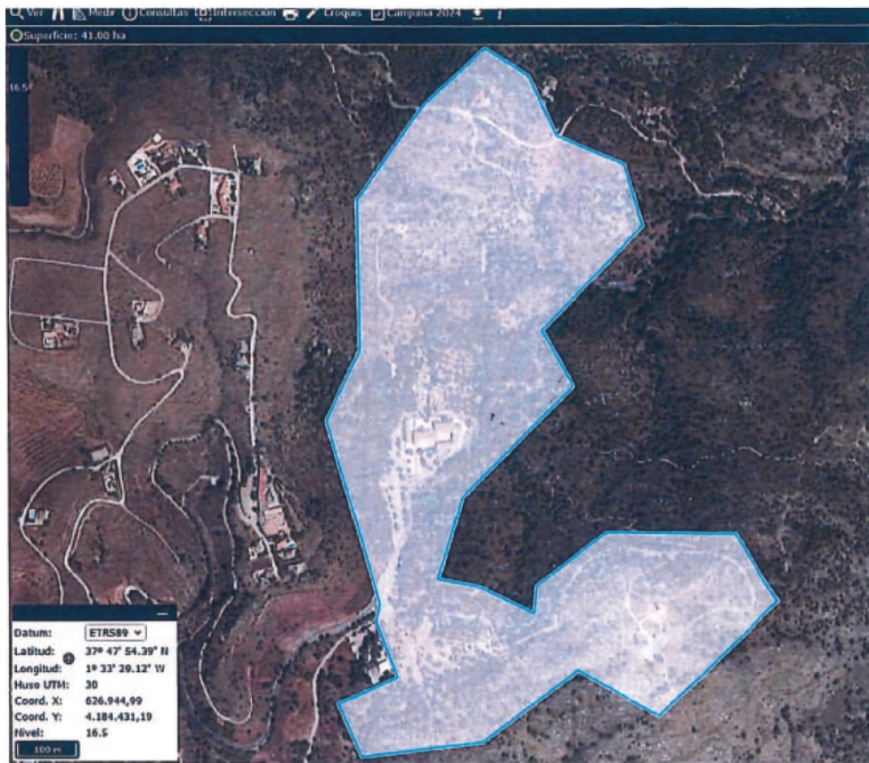
Fotografía 1: Zona exclusión entorno de La Santa