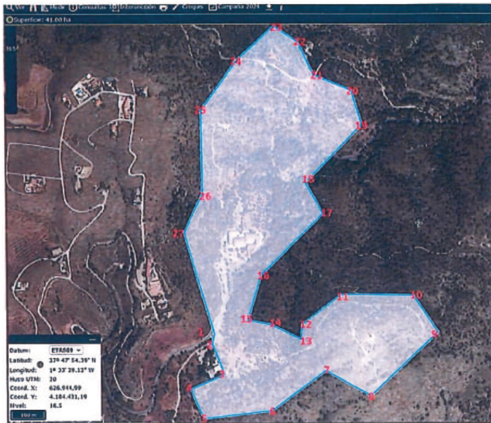
Fotografía 2: Coordenadas