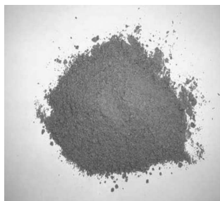
Fotografía nº 2