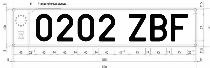
MATRÍCULA POSTERIOR VEHICLES AUTOMÒBILS ORDINÀRIA LLARGA TAXI I LLOGUER AMB CONDUCTOR FONS BLAU CARÀCTERS BLANC MAT

c) En el quadre 2 de l'apartat IV. «Dimensions i especificacions de les plaques i dels seus caràcters», entre el dibuix de la placa de matrícula de vehicles automòbils ordinària llarga davantera i el dibuix de la placa de matrícula de motocicletes ordinària, s'inclouen els dibuixos de plaques de matrícula següents: