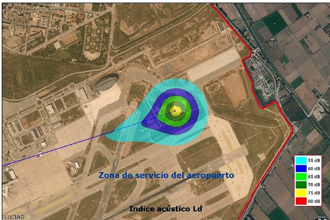
Figura 3, Mapa de isófonas del índice acústico Ld y la zona de servicio del aeropuerto

En este sentido, además de no producirse un incremento significativo de la superficie total expuesta, tampoco se superan los objetivos de calidad fijados en ninguno de los tipos de áreas acústicas incluidas en la tabla A del Anexo II del Real Decreto 1367/2007 y en ninguno de los dos supuestos de la VAC. Por lo tanto, no existen diferencias entre ambas propuestas en lo referente a la superación de niveles sonoros de inmisión en las áreas receptoras más sensibles (residencial, sanitario, docente,...), que es nulo.