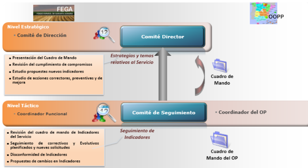
Ilustración 3. Modelo de control y seguimiento de indicadores

Al final de cada año natural, se realiza un informe resumen o balance de los indicadores en función de los cuales se podrán tomar las decisiones que se acuerden.