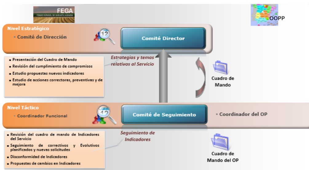
Ilustración 3. Modelo de control y seguimiento de indicadores

Al final de cada año natural, se realiza un informe resumen o balance de los indicadores en función de los cuales se podrán tomar las decisiones que se acuerden.