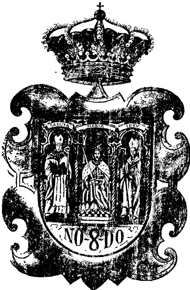
ANEXO 1: Anverso de la Medalla que se propone

Finalmente, en el reverso de la Medalla, un escudete liso, en la misma forma y tamaño que el del anverso, y grabada la leyenda: «Universitas Hispalensis»; todo ello según modelos que se acompañan.