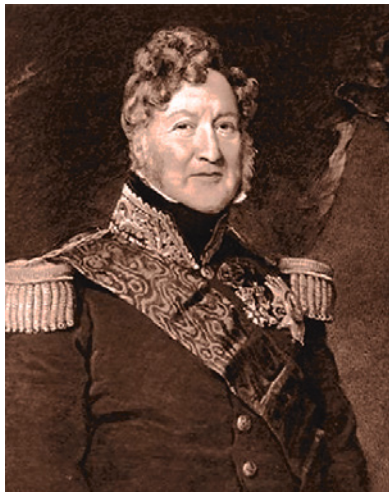
Luis Felipe I en un grabado de la época

la sobrina carnal de la esposa de Luis Felipe, la reina María Amelia de Borbón dos Sicilias.