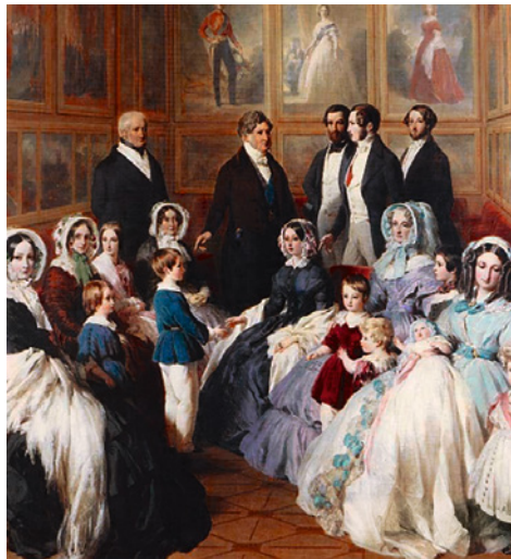
Franz Xaver Winterhalter: Luis Felipe y la reina Victoria en Eu, 1845

La candidatura del conde de Trápani, el hermano menor del rey de las dos Sicilias y hermano por tanto de la reina madre, es admitida por los franco-británicos. Es un candidato alejado de cualquier conflicto diplomático, pero rechazado por los dos principales partidos españoles. Para los progresistas, Trápani representa el conservadurismo y la reacción de la corte de Nápoles, y se lo desacredita por su educación con los jesuitas y su religiosidad, lo que para el partido supone colocar en el trono un elemento indeseable. El partido moderado es más sutil en su análisis: Trápani, de diecinueve años en 1846, es el hermano de la reina madre, con lo que la influencia de ésta sobre la joven pareja sería enorme; Narváez desea eliminar esa influencia y combate la candidatura napolitana.