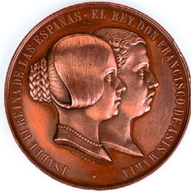
Medalla conmemorativa del matrimonio real Museo del Romanticismo, Madrid