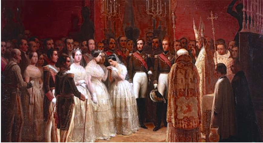
Las bodas reales, 10 de octubre de 1846, en un cuadro de Girardet

En política interior, el desasosiego en la vida privada de la familia real española fue aprovechado por los partidos según las conveniencias del momento, y el malestar en la vida de palacio repercutió en la estabilidad de España y sus gobiernos. Finalmente, la revolución de 1848 tendría en España un eco tardío veinte años después.