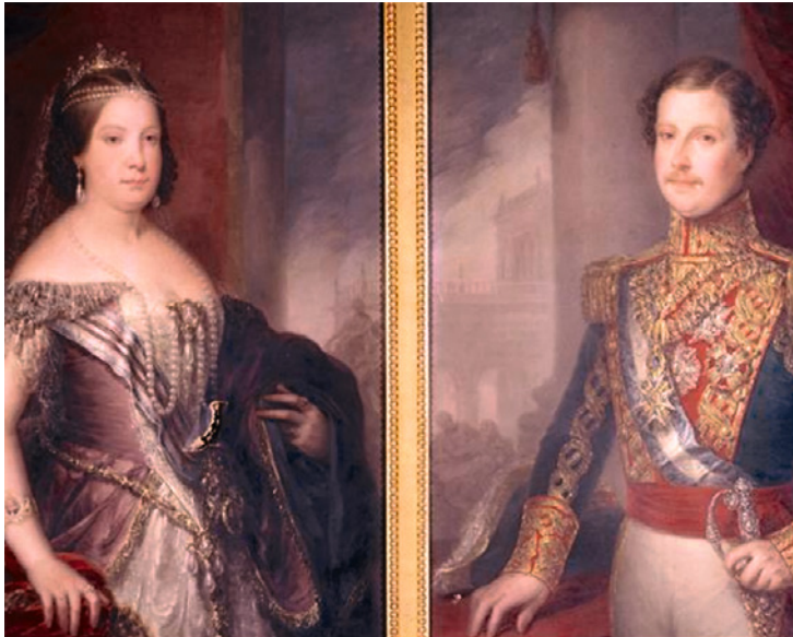
Isabel II y Francisco de Asís en 1846, autor desconocido, Biblioteca Nacional de España

En política interior, el desasosiego en la vida privada de la familia real española fue aprovechado por los partidos según las conveniencias del momento, y el malestar en la vida de palacio repercutió en la estabilidad de España y sus gobiernos. Finalmente, la revolución de 1848 tendría en España un eco tardío veinte años después.