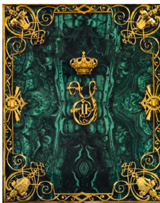
Monograma de Isabel II, Palacio Real de Madrid, Biblioteca Real