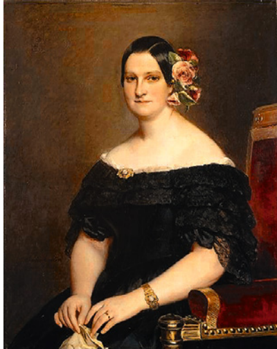
Franz Xaver Winterhalter: María Cristina en 1840

definir sus áreas de influencia en Europa, como anteriormente había sucedido con Grecia y Bélgica tras sus respectivas independencias.