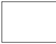
(fotografía do alumno)

DNI ou NIE ( ou, en defecto de NIE, número de pasaporte) ..... Primeiro apelido..... Segundo apelido..... Nome..... Data de nacemento..... Lugar..... Provincia..... País..... Nacionalidade ..... Pais ou titores: Don ..... Dona..... Domicilio: