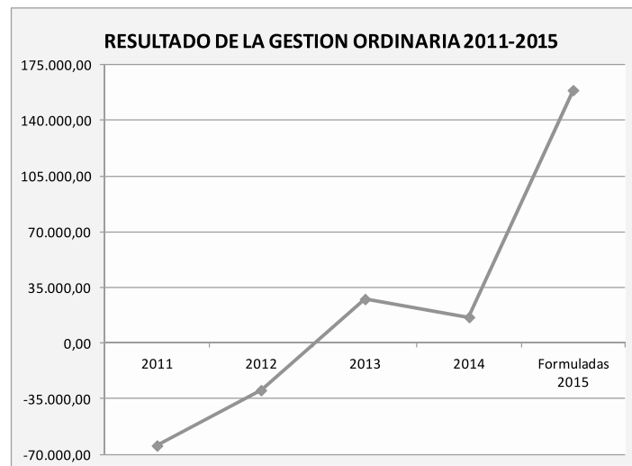
Gráfico 2.- Evolución del Resultado de la Gestión Ordinaria. 2011-2015 (Euros)

Podemos resumir que en el avance de cuentas de 2015 se ha logrado reducir el saldo negativo del ejercicio en un porcentaje de casi el 75% respecto al ejercicio 2011. Un análisis más detallado permite observar como el resultado del ejercicio ajustado de amortizaciones deja de