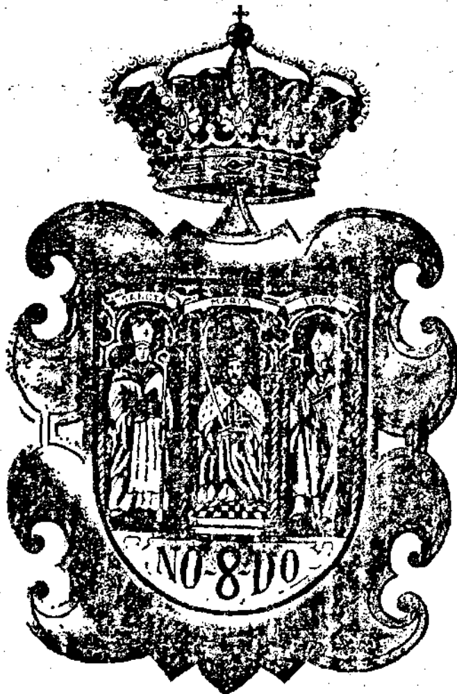
ANEXO 1: Anverso de la Medalla que se propone

Finalmente, en el reverso de la Medalla, un escudete liso, en la misma forma y tamaño que el del anverso, y grabada la leyenda: «Universitas Hispalensis»; todo ello según modelos que se acompañan.